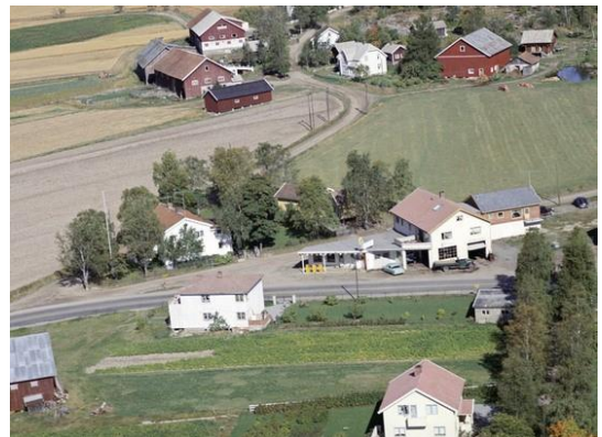
Borgen 1961.