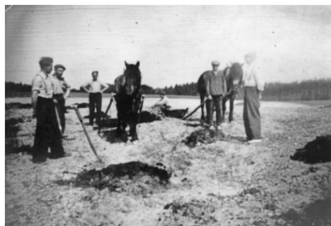
Dugnad da idrettsplassen ble utbedret på 50-tallet.

Hva gjorde vi da? Jo, den som var flink til å klatre ble sendt opp og vedkommende måtte jo ganske langt opp til der hvor det var mange kongler. Jeg hadde den jobben noen ganger. En gang, da prisen på kongler var høy, tok vi en slik tur. Det var vinter, mye nysnø. En av oss opp i treet og en annen sto nede i nysnøen. En stor kongle borrar seg et stykke ned i slik snø. Hvem hadde den letteste jobben, han som klatret opp eller han som leita nede i snøen? Veit ikke, men litt moro dette. Det ble heldigvis kongler i sekken og dermed penger til idrettslaget.