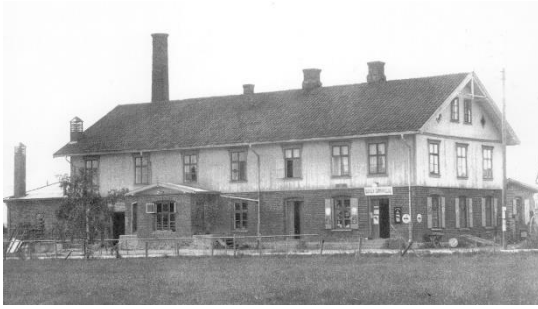
Borgen Meieri 1927.

Vinden sto fra vest mot øst den natta, så Ringnesbutikken like ved var visstnok ikke truet etter det jeg vet. Mens huset mot øst, «Villa'n», der ble garasjen antent to ganger, men brannvesenet klarte å slokke der og holdt brannen unna bolighuset («Villa'n»). Det var visst også slik at det var små antennelser andre steder også, men de ble slukket.