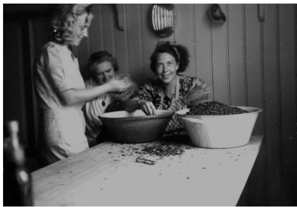
Rensing av bær.

Slåttonna var en travel tid – vinterfôret til kuer og hester skulle berges. Høyhesjinga var arbeidskrevende, men det var en sikker måte å få god kvalitet på høyet. Nå ble det hyret inn en voksen kar og ofte en ungdom, som tok en jobb i skoleferien for å tjene noen kroner. Høyonna varte oftest hele juli og hvis det var mye regnvær, også noen dager ut i august. Grøfte- og bekkekanter ble slått med ljå og tørket på bakken. Hakkeslåttan ble dette kalt.